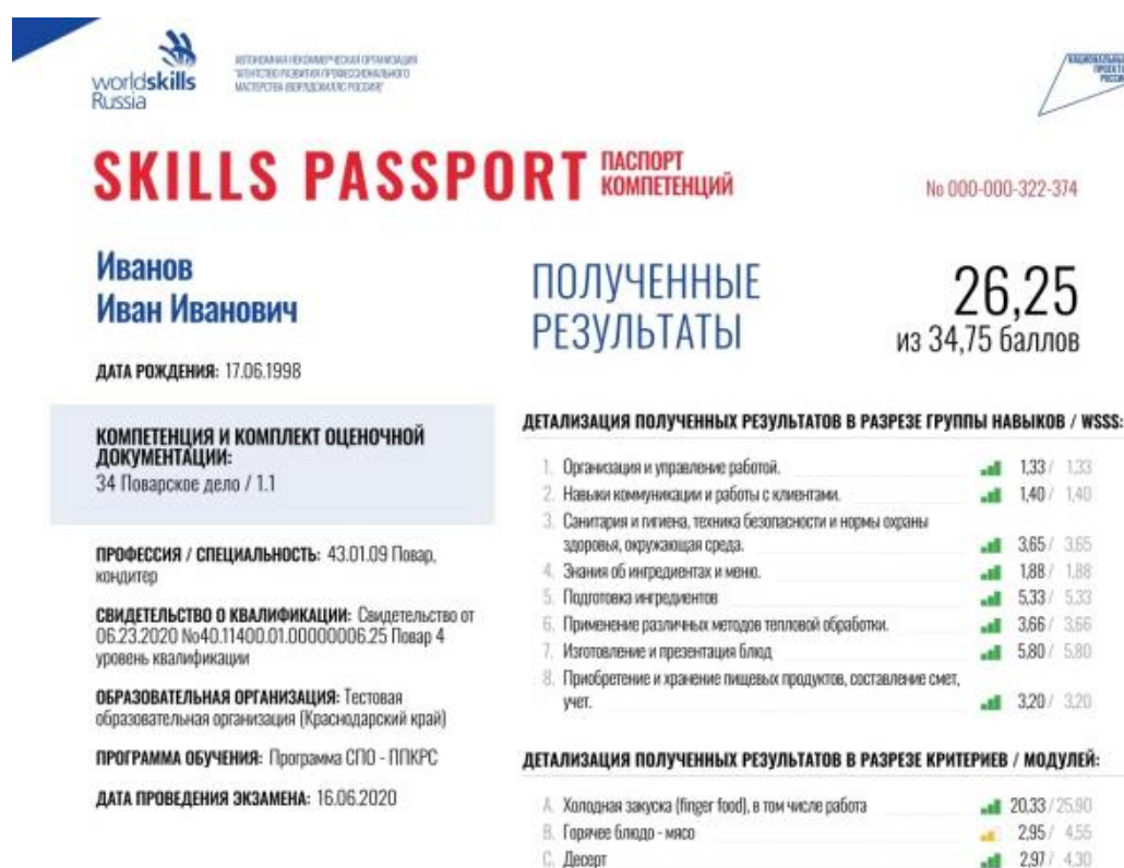
Рис. 4. Пример Skills Passport