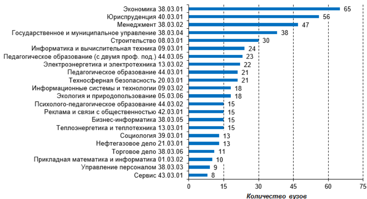
Рис. 1. Распределение вузов по направлениям подготовки

Результаты исследования и их обсуждение. Федеральный интернет-экзамен для выпускников бакалавриата (ФИЭБ) проводится на добровольной основе, при желании обучающихся проверить свои знания и реализуется с использованием междисциплинарных педагогических измерительных материалов (ПИМ), которые разрабатываются профессорско-преподавательским составом ведущих вузов России [2]. Все материалы, которые выдаются выпускникам для проверки знаний, проходят процедуру внешней экспертизы. По состоянию на 2020 г. в интернет-экзамене приняли участие 132 вуза из 55 регионов РФ и СНГ по 22 направлениям подготовки (рис. 1, 2).