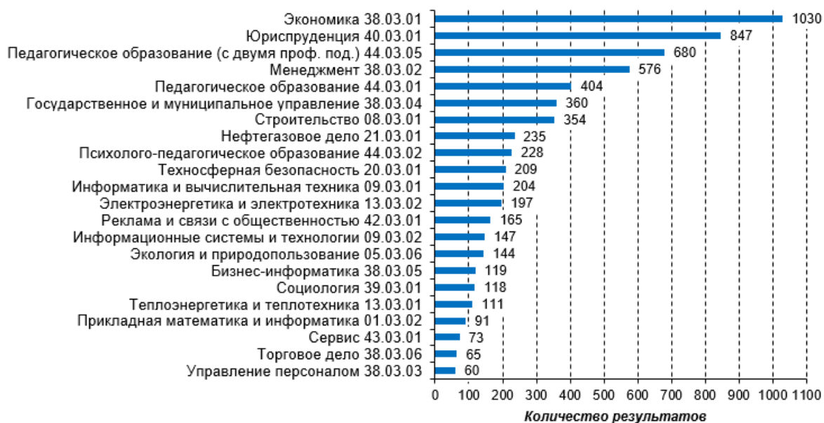
Рис. 2. Распределение результатов по направлениям подготовки за 2020 г.